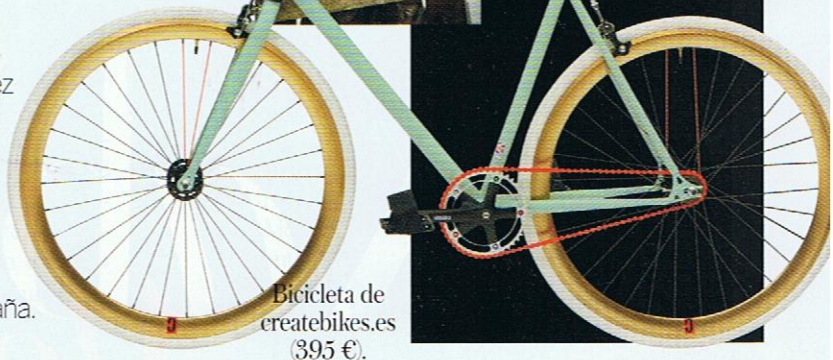
Bicicleta de createbikes.es (395 €).

LA BICICLETA Plaza de San Ildefonso, 9. Madrid. (Tel. 971 577 154).